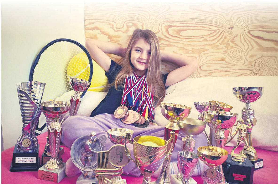
Успех в спорте или бизнесе не гарантирует счастья и душевного благополучия

– Бывает. Это зависит от многих факторов, стечения обстоятельств. И поэтому профориентацию я считаю глупостью. Это накладывание на человека штампа. И не дай Бог человек сам в этот штамп поверит, будет им ру-