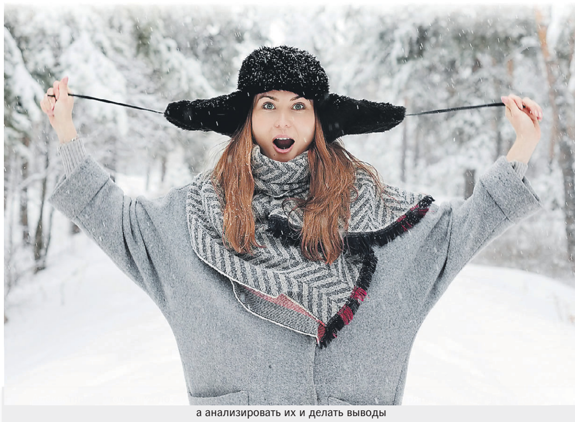
а анализировать их и делать выводы

Позитивная эмоциональная оценка со стороны родителей формирует адекватную самооценку ребёнка: рады ли они приходу малыша в их мир, готовы ли впустить