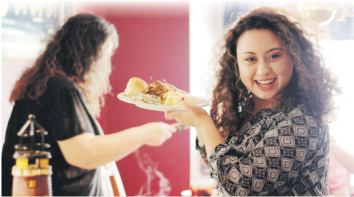
Не пере едайте, даже если обед очень вкусный. Лучше есть маленькими порциями, но почаще.